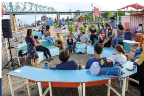
Village au Pied-du-Courant