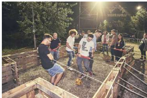
Pessoa Luna Park 2019