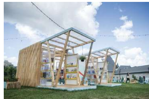
La Pépinière - Chapitre d'été