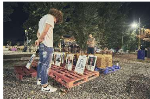
Pessoa Luna Park 2019