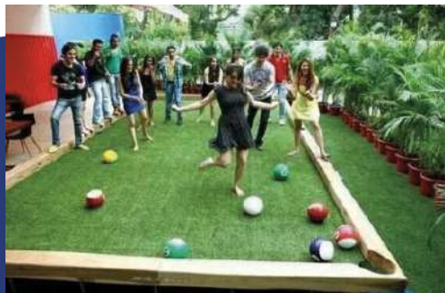
Pinterest, non definito