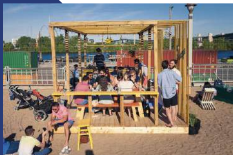
Village au Pied-du-Courant