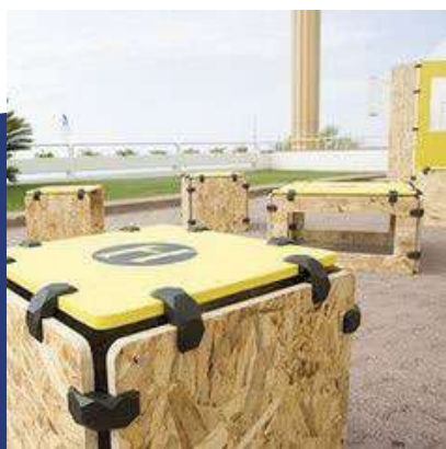
Pinterest, vedi connettori in plastica